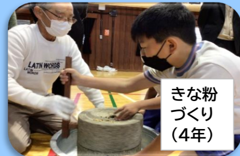
きな粉 づくり (4年)