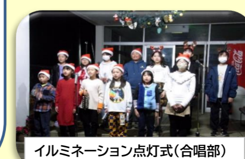
イルミネーション点灯式(合唱部)