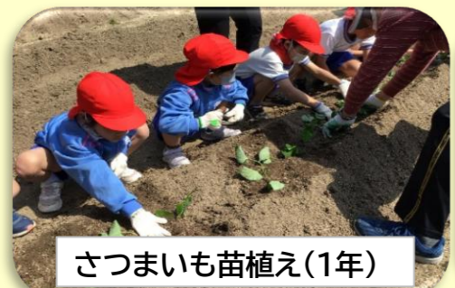
さつまいも苗植え(1年)