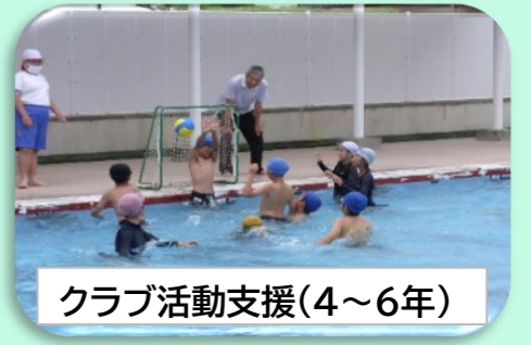
クラブ活動支援(4~6年)