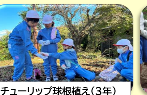
チューリップ球根植え(3年)