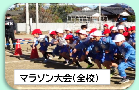
マラソン大会(全校)