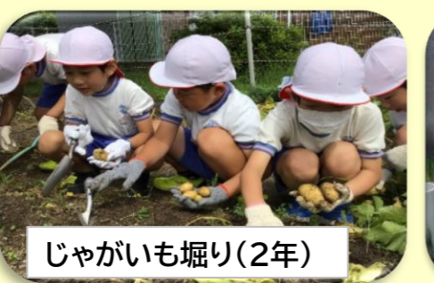
じゃがいも掘り(2年)