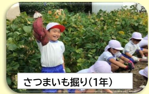
さつまいも掘り(1年)