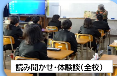
読み聞かせ・体験談(全校)